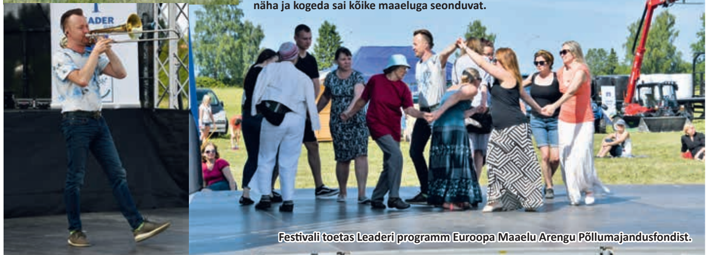
Festivali toetas Leaderi programm Euroopa Maaelu Arengu Põllumajandusfondist.