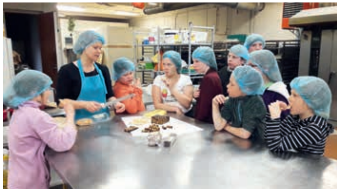
Kogu tõe pagari argipäevast käisid uudistamas Uhtna lapsed.

läksid pitsad ahju. Oh seda ootamist ja vaatamist ahju kõrval. Lõpuks nad valmis saidki. Mitmed noored leid-