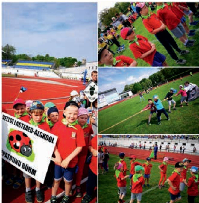
Veltsi lapsed Rakveres liikumispeol.