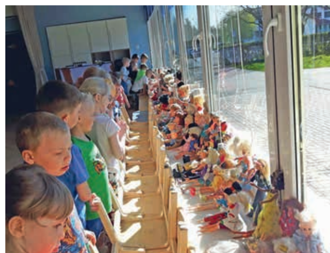
Uhtna lasteaia nukukude näitus.