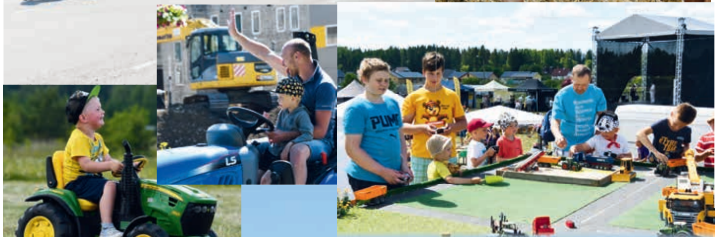
Selja taha on jäänud kolm meeleolukat Lambafestivali ja 2. juunil pandi võimas punkt Svjata Vatra lauluhelide saatel 3. Maaelufestivalile, kus näha ja kogeda sai kõike maaeluga seonduvat.