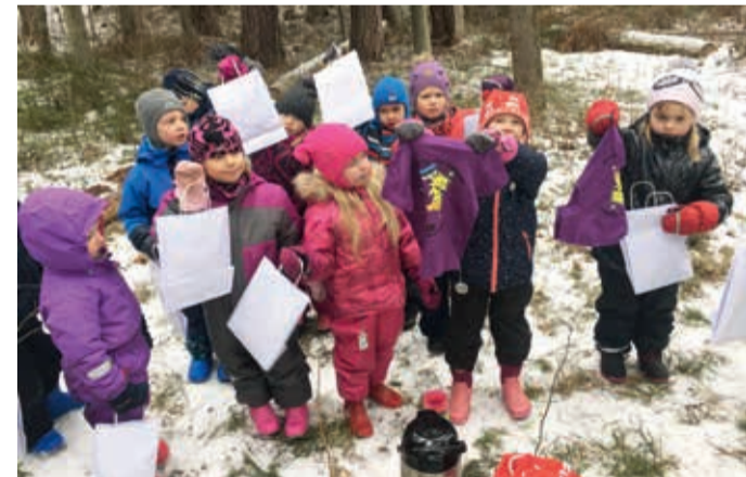
Kevadmatk Käsmu.