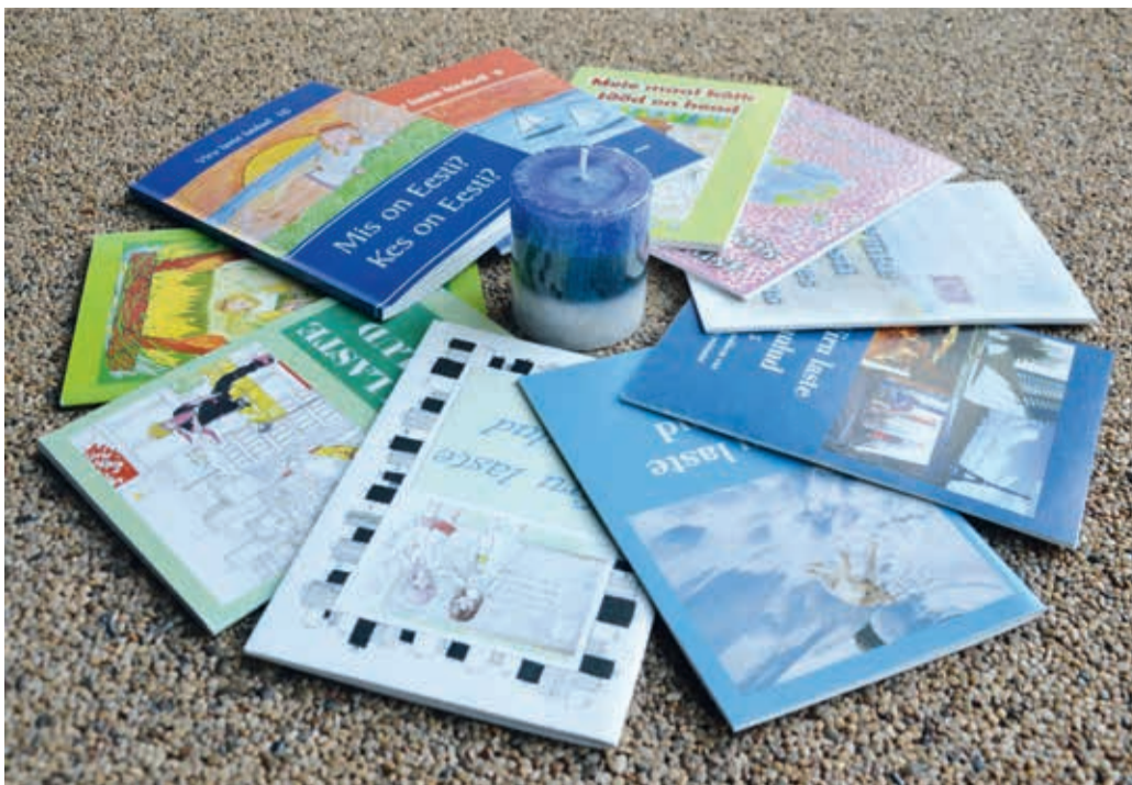
Sõmeru kooli eestvedamisel on valminud 10 luulekogu.

Luuleviistluse pidulik lõpetamisel kantakse traditsioonikohaselt ette valimik