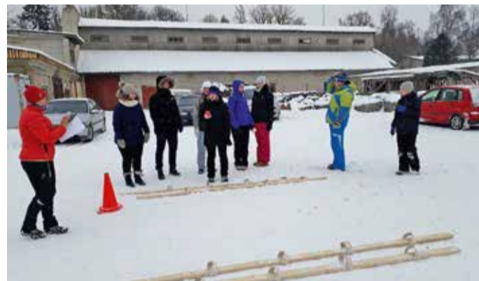
Enne mõtle, siis sõida!