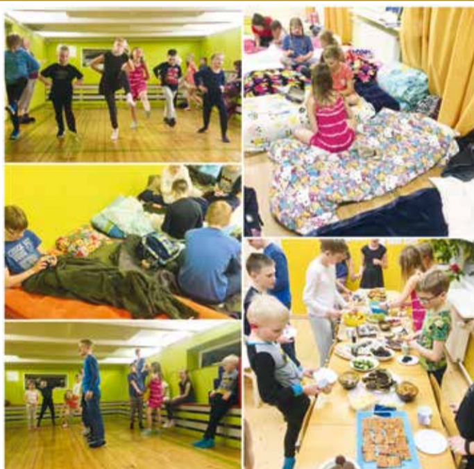
Koolis toimus traditsiooniline pidžaamapidu mida hakatakse ootama juba sügisel.