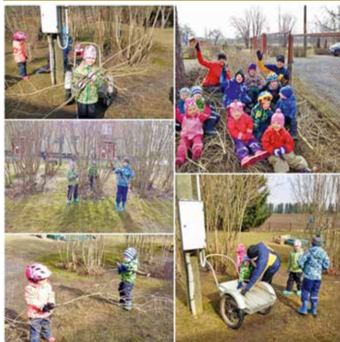
Lasteaias tehti kevadtöid. Oli lõbus ja töökas päev nii suurtel kui väikestel. Teeme ikka kõike koos ja oksahunniku saime suure.