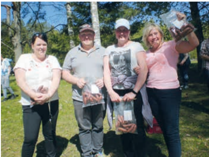
Grillimeistrid perepäeval Oandu.