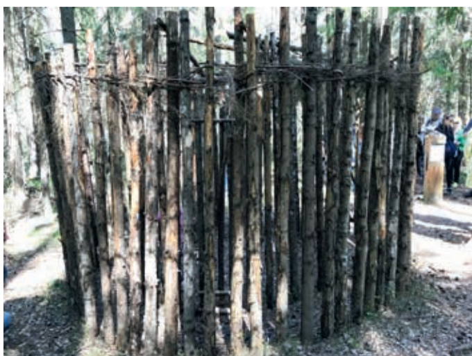
Hundiaed ehk hundilõks Oandu looduskeskuse kultuuripärandi matkarajal.