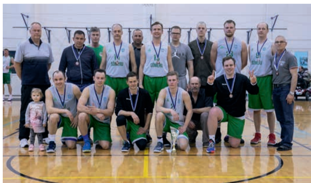
Meie tublid korvpallurid.