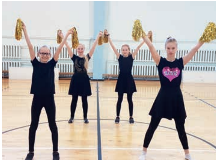
Meie korvpalli oma tantsutüdrukud.