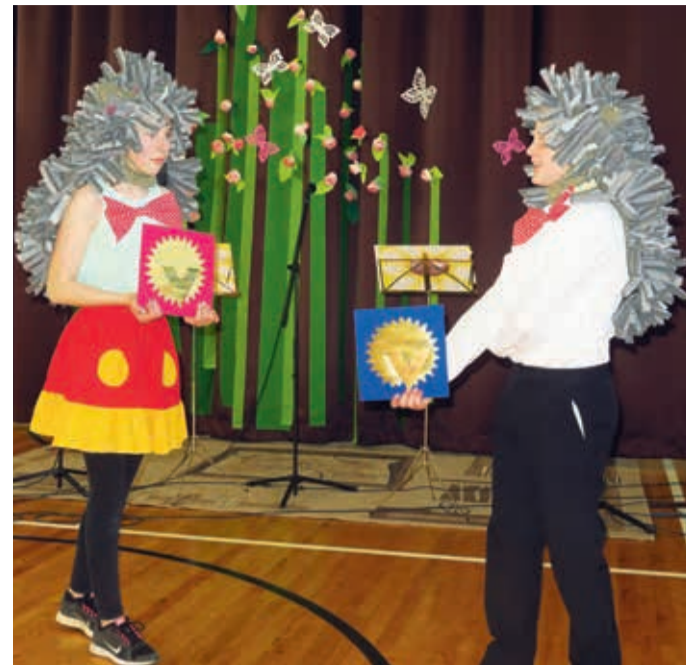
Kooli sümbolid siilid kannavad endas ikka usku, lootust ja teotahet kindlal sammul seatud sihi poole liikuda.