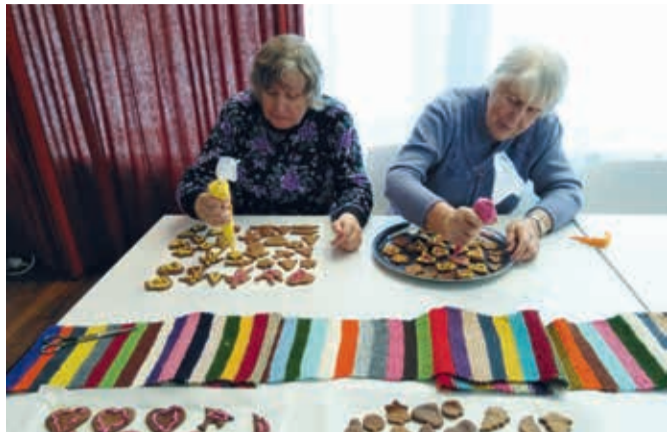
EVIDel tegemisi jagub, jõulude eel valmistati piparkooke ja läbi hooaja on kohtunud erinevate külalistega.

Sõmeru päevakeskuses käib igal esmaspäeval koos eakatest ja erivajadustega inimestest koosnev grupp EVI.