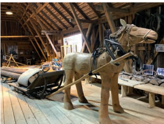
Oandu looduskeskuse näituste küün.

Lisaks kuulsid loodusesõbrad põnevaid lugusid mõisaegsetest piirikividest ja suitsetamise aladest. Saadi teada, miks keset paksu metsa asuvad mitmete kilomeetrite pikkused kiviaiad ning pajatati mõisani viivatest teeviitadest ehk verstapostidest. Mõõdeti puid "karjapoisi" meetodil ning prooviti vahet teha erinevatel "metsašokolaadidel" (loomade väljaheidetel), samuti jänesekapsa ja ülese õitel.