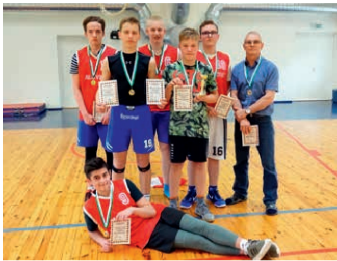
Sõmeru põhikooli meeskond.