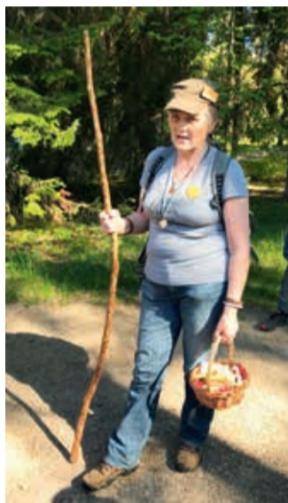
Giid Ene Riiberp pajatamas Oandu kultuuripärandi rajal.

Kõige sellega tutvust tehti. Võeti ette metsaretked ning külustati näituseid küünis ja Käbitares. Väiksemad loodusesõbrad (1.-3. klass) tutvustid erinevate taimedega ja õppisid tundma erinevaid linde. Keskmise vanusegrupp (4.-6. klass) liikus taime-rajal. Matkalised punusid võilillepärja ja omandasid erinevaid teadmisi loomade kohta. Vanem vanuserühm (7.-9. klass) matkas kultuuripärandi rajal ning piilus korra sisse Käbitaresse. Koguti palju uusi teadmisi. Elevust tekitas hundiaed ehk hundilõks. See oli kitsa vahega kahekordne aed.