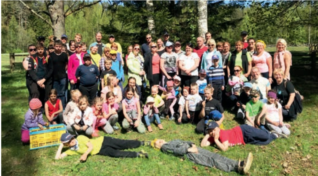
Rõõmsad perepäevalised Oandu, kes pidasid vastu ürituse lõpuminutiteni.