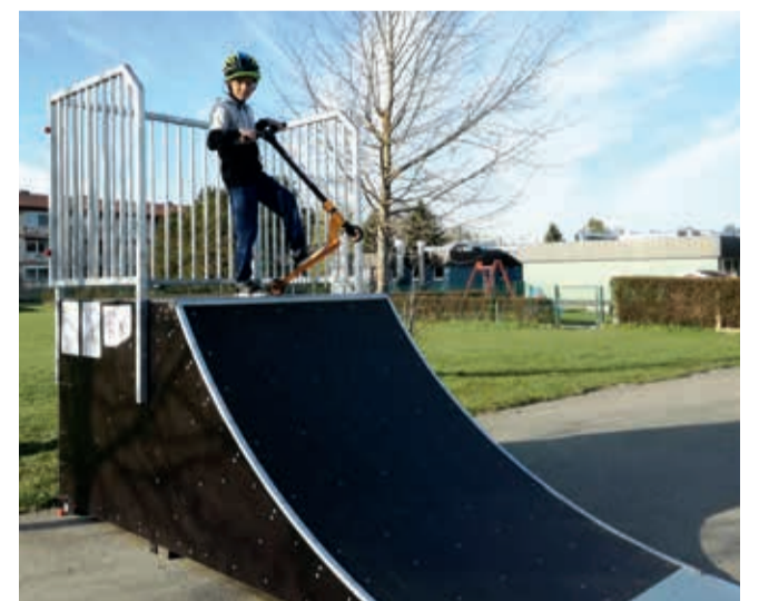
Quaterpipe ehk veerandrenn jõudis Uhtnasse.

Aastatega loodetakse külaväljakul olevat rulaparki suurendada elementide haaval. Et kasutamiseks suurem oleks, käitu mänguväljakul heaperemehelikult ning hooli enda ja teiste turvalisusest.