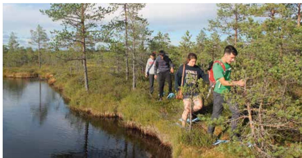
Wanderest itaallastega räätsamatkal.