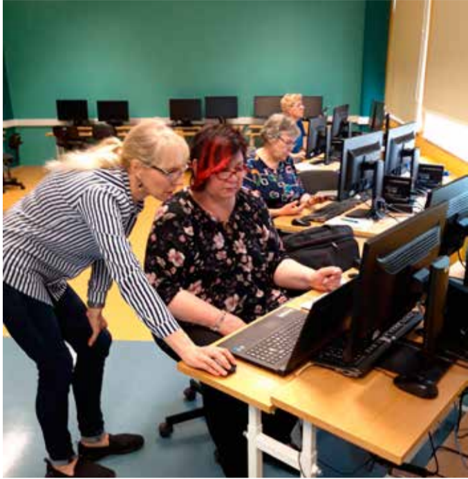
Juhendaja käe all uusi oskusi omandamas.

Aeg muudab maailma kiiremini kui sooviksime. Tehnoloogia areng ning nüüdisaegne õpikäsitus esitavad väljakutseid ka haridusele, seavad uued nõudmised õpetajale ja õppijale. Et ajaga kaasas olla, tuleb kaasa minna ning pigem istuda tõttavas rongis ja vaadata aknast maastikku, kui olla raudtee ääres mööduvale rongile lehitamas.