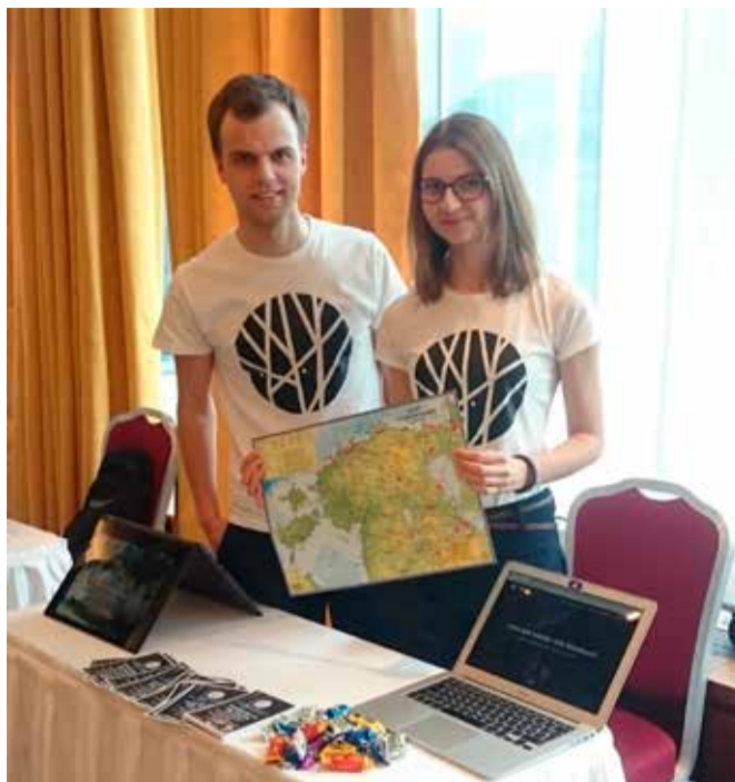
Wanderest loomas kontakte keskkonnaprobleemide, kodanike kaasamise ja sotsiaalse ettevõtluse parendamise valdkondades Budapestis 2019. aasta aprillis.

“Wanderesti loomine on olnud väga põnev ja õpetlik protsess. Esimesel hooajal ehk eelmise aasta suvel aitasime Eesti loodust kogeda ning tundma õppida inimestel