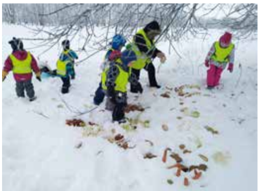
Metsloomadele süüa viimas.