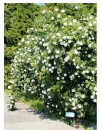
Pargiroos `Alba Suaveolens' Järvselja õppe- ja katsemetskonnas.