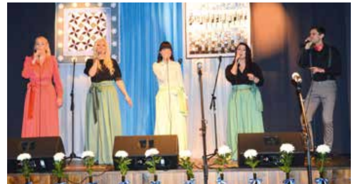
Meeleolu lõi vokaalgrupp Mirt.