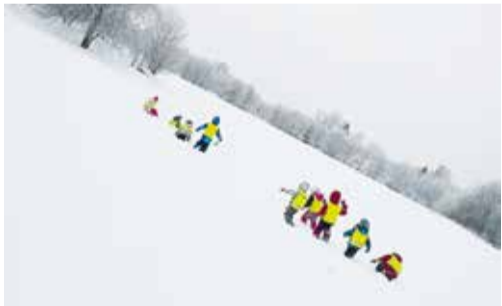
Lepatriinude rühm on igal talvel käinud metsloomadele toitu viimas.

Jaanuar-vebruar on Velt- si lasteaed-alkoolis endaga kaasa toonud nii mõndagi põnevat. 18. jaanuaril oli stiil- päev, mille teema oli prügi- kott riietuselemendina. Tuli kasutada loovust ja mõelda, kuidas kasutada prügikotti nii, et olla omapärane ja stiil- ne. Iga laps sai nõ poodiumil kõndida ja oma riietust teis- tele näidata. Tore, et lapseva- nemad olid agarad leiutajad - päris palju lennukaid ideid oli riietustes näha.