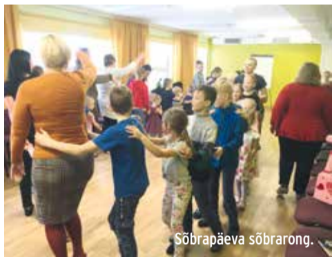
Stiilpäev prügikotist riietusesemed.