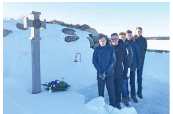
Lasila koolinoored mälestamas Eesti Vabadussõja Jõepere lahingus (18.12.-22.12.1918) langenuid.