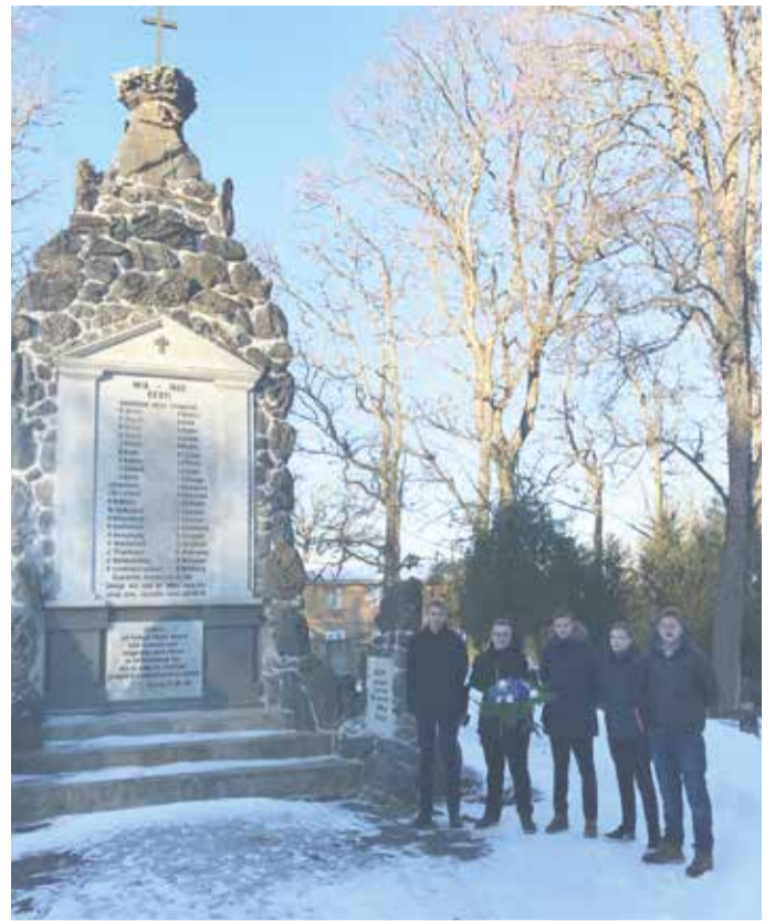
Lasila koolinoored avaldamas austust Eesti Vabadussõjas langenuile.