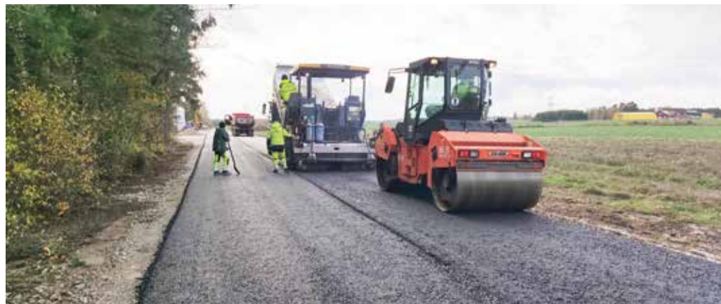
Rehe tee rekonstrueerimine.

Rööm on, et Ussimäe uusarenduse valmis Vaskussi tänava tee muldkeha (250 m) ning riigilt elamukinnistu soetanud kodanikud saavad asuda oma eramuid püstitama. Lisaks sai pikendatud Ussimäe