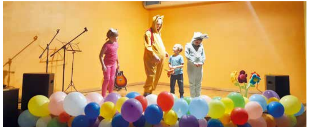
„Niipea kui ma sind nägin, taipasin ma, et mind ootavad ees seiklused,“ tõdesid sünnipäevapeol karupoeg Puhh, Notsu ja eesel Iiah. Ka Sõmeru noortekeskuses ootavad iga päev seiklused.