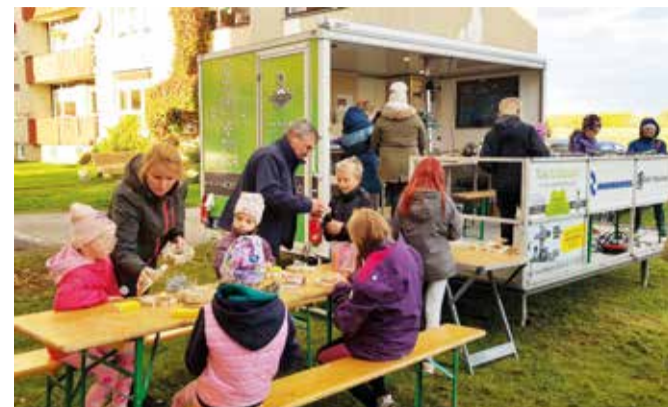
Mobiilne töötuba Lepna noortekeskuse juures.