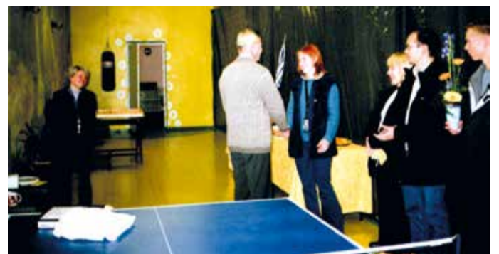
Nii see kõik oli alguses: kiletatud seinad, jahe õhk, aga inimesed olid täis tegutsemisetaht.

Keskus võeti üllatavalt hästi omaks. 16-aastased ja vanemad hakkasid ennast ise korraks kutsuma, sest alko-