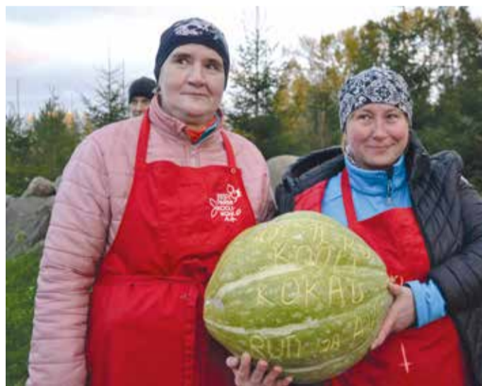
Sõmeru põhikooli kokad kõrvitsarallil.

15. oktoobril toimus Rakvere valla esimene heategevuslik kõrvitsaralli. Selle eesmärgiks oli koguda kokku valla kõrvitsasaak 31. oktoobril Tallinna loomaaias toimuva kõrvitsapeo jaoks ning veeta üks mõnus sügisõhtu värskelt valminud Sõmeru aleviku valgustatud terviserajal. Osalejatel tuli 1-3 liikmelise võistkonnana kõrvits turvaliselt stardist finišisse toimetada. Rallist võttis osa 15 võistkonda, üle 40 võistlejaga, lisaks oli kohale tulnud hulgaliselt toetajaid ja kaasaelajaid. Suurim kaalule jõudnud kõrvits küündis 22 kiloni. Kõrvitsarallist võtsid osa nii pingviinid kui