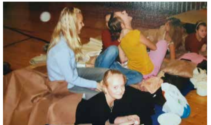
Lõbu oli laialt.

hoolihõnadega noortetuppa ei lubatud. Kiiresti vähenes ümber lasteaia aega surnuks lõovate noorte arv. Seevastu