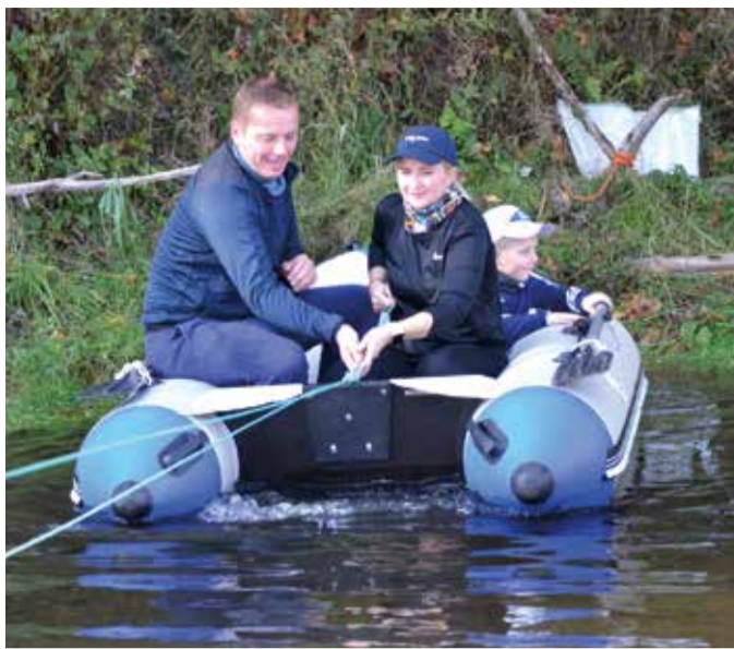
MTÜ Seiklusmatkad punkt.

Rakvere valla spordi- ja tervisedenduse spetsialist