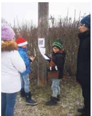
Uhtna kooli õpilased testimas.