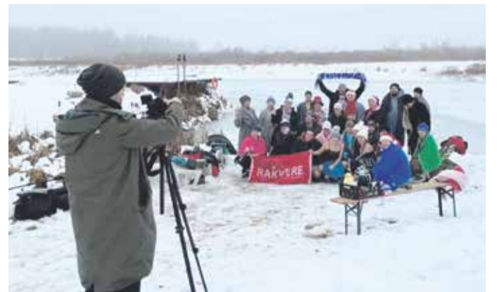
Üle-eestiline ühisüritus, millest viimased 6-aastat oleme ka meie osa võtnud – 31. detsembril kastan end vette. Seekord oli vee temperatuur +0,2 kraadi.