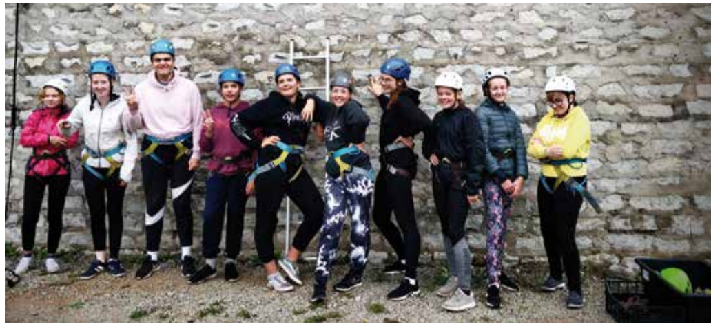
Malevlased hakkavad kõrguseid vallutama.

Esmaspäeva hommikul kogunes Uhtna kooli ette 12 särtsilmselt noort, kaks ootusärevat rühmajuhti ja tegutsemisindu täis maleva juht. Üheks nädalaks sai nende koduks Uhtna kool ning tööandjateks Rakvere vallavalitsus ja osuühing Uhtna Puit. Magamisajad kooli viidud ja vanematele järele lehitatud, tuligi tööle asuda. Osad malevlased läksid laoplatstile lauavirna ümber laduma ehk laudu staabeldama ning teised võtsid ette külaplatsi korrastamise. Neljatunnine tööpäev möödus tegusalt. Selle aja jooksul jõuti ümber tõsta ligi 1000 lauda, rohimise käigus täita pea 50 ämbrit umbrohuga ning korjata ja puhastada kaks ämbrit tikreid. Ka järgmistel päevadel jätkusid tööd ja toimetused külaplatsil, kooli ümbruses ning Uhtna Puidu laoplatstil.