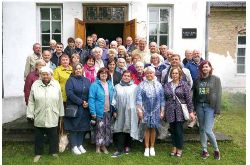
Ühispiilt Karitsa kooli ees.

Autor Helje (Valter) Karrofeldt Mädaapea koolilaps 1956–1960