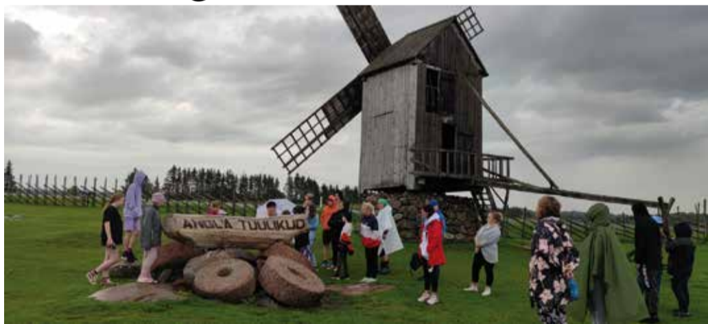
Angla tuulikud uudistamas.

Kolmandal päeval küllastasime Lümända lubjapark. Edasi suundusime Panga pangale, kus olime algul panga all, seejä-