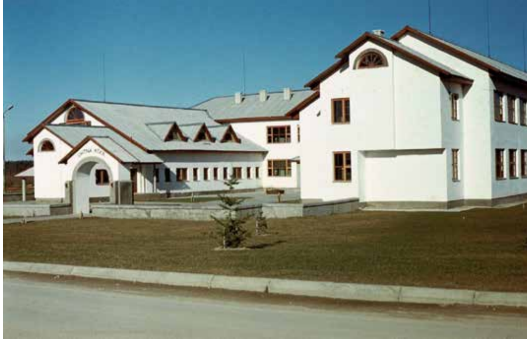
Uhtna koolimaja mõneaastasena.

Jah, selle kirjandusest tuttava püüdliku ja korraliku Paunvere poisi hilinemise võib ehk seekord isa või hobuse süüks ajada, aga ... Käsi püsti, kes teist pole mitte kordagi tundi hilinenud? Midagi kellegi pealt maha kirjutanud või spikreid teinud? Enda päästmiseks veidikene valetanud? Oma õiguse kaitseks rusikaid vibutanud? Kedagi kellegagi (kasvõi mõtetes) paari pandud? Klassiõesse või klasisivenda armunud olnud? Omavahel õpetajat aasinud? Käsi tõusis nii ja naa, mis tähendab seda, et igas Eestimaa koolis on omad Tootsid ja Teeled,