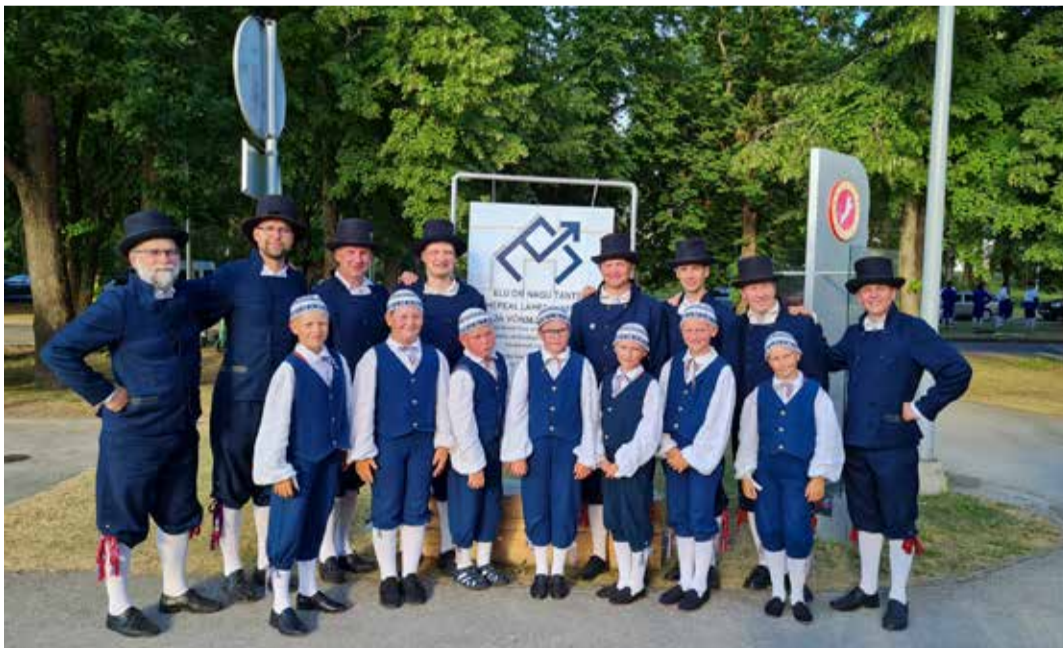
Sõmeru poisid vanaisadega ehk Tartu ülikooli vilistlastega.