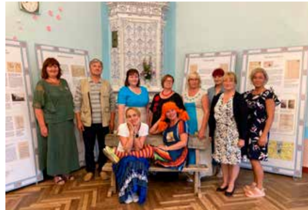
Ürituse Meitel on mõnus tänuilik korraldusmeeskond.

Looduse Pärl Karivärava külas , kus külastajad said osaleda looduskosmeetika töötoas, meisterdada kadakast kuumaaluseid ja vihtasid, lõhnameeli paitas lavendlipõld, meeleolu küttis kettagolf, meelepärast leidis müügilettil ja kohvikust. Külas oli ka Kirevene Mulk oma linaste rõivaste ja ehte valmistamise töötoaga.