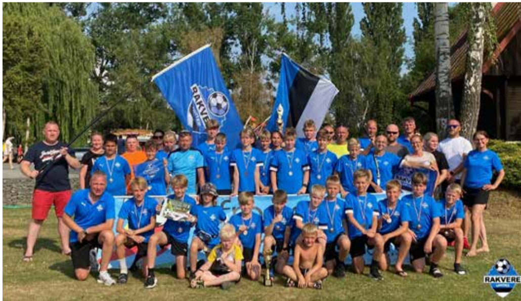
Slovakkia 2022 – seltskond turniiri lõpus.