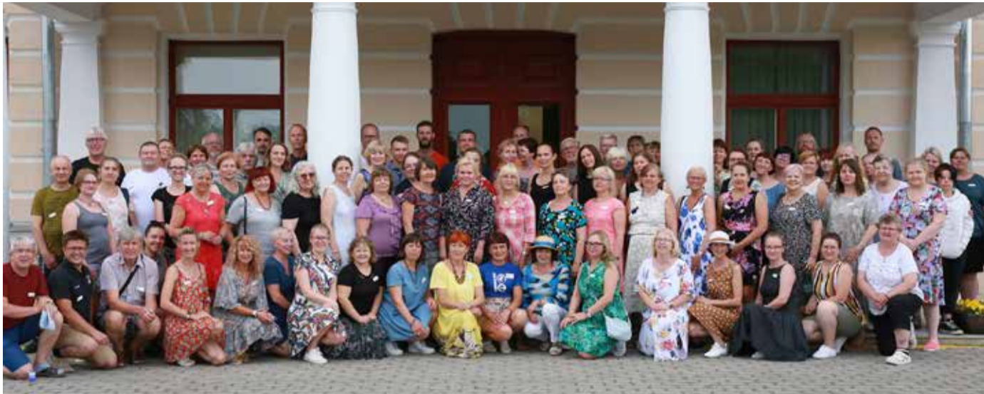
Rakvere suvekursus 2022.