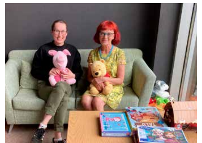
Lastenurgas on lisaks raamatutele ka Puhh ja Notsu.