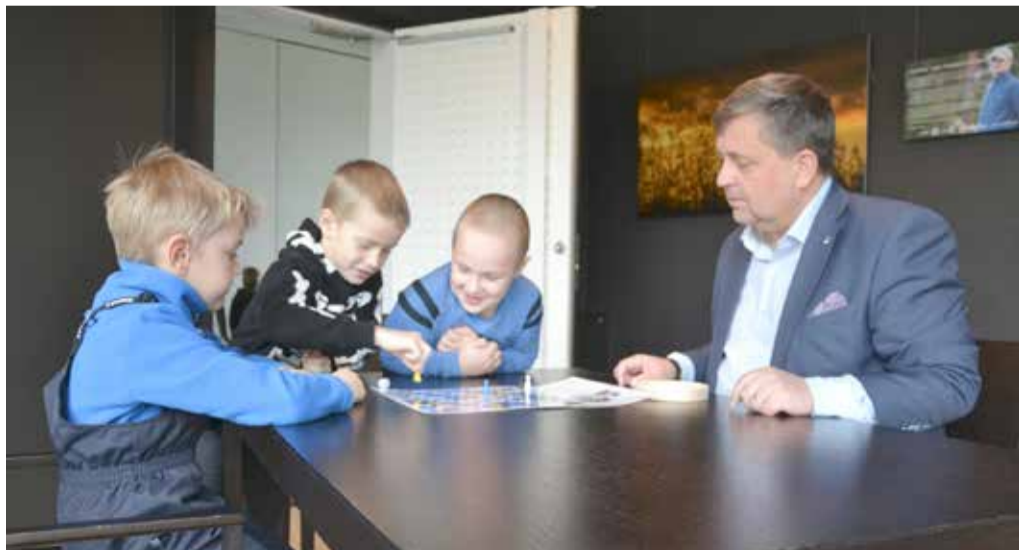
Seikluslik lõuamäng vallavanemaga.

Vallavanem võttis vastu kõik õnnitlused ja kut-