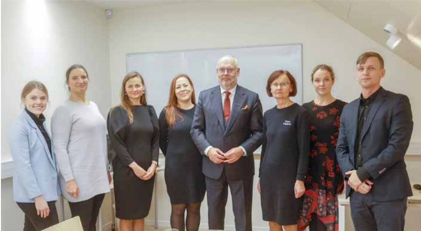
President visiidil Uhtna koolis.

Statistika ütleb, et ligi viiendik põhikooli lõpetajates ei jõua nelja aastaga