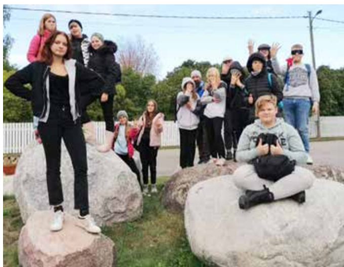
Pea uusi Käsmu tarkusi täis. 5.–7. klass.

22. septembril pakkisid kokad õpilastele lõunasöögi kaasa ja järjekordne bussisõit Lahemaa looduse päevale võis alata. Terve koolipäev möödus 5.–7. klassi õpilastele Käsmus. Seal ootas ees 4,2 km rada, mida läbiti viieliikmeliste meeskonnadana. Kontrollpunktides ootasid tegevused erinevatelt keskkonnahariduse pakkujatelt. Rajal olid ka mõned mehitamata punktid iseseisvate ülesannetega. See oli parim viis kogeda erinevaid võimalikke loodushariduslikke tegevusi ja teemasid Lahemaal.