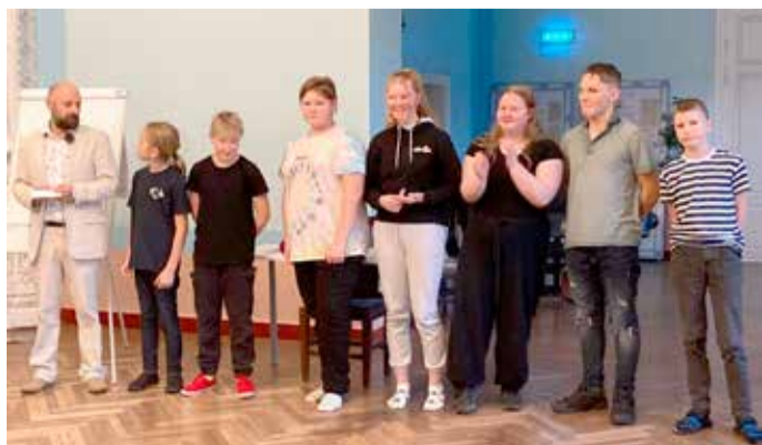
Enim hääli saanud õpilasesinduse liikmed.