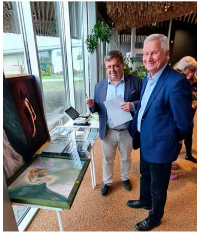
Vallavanem ja volikogu esimees valla sünnipäevaüritusel.