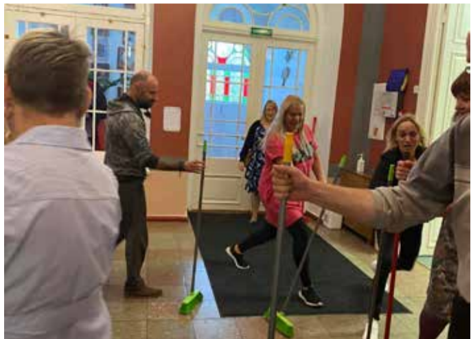
Osavusmäng pakkus pinget.