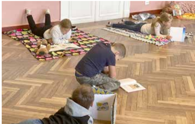
Hommikujooga asendus sujuvalt lugemistunniga.