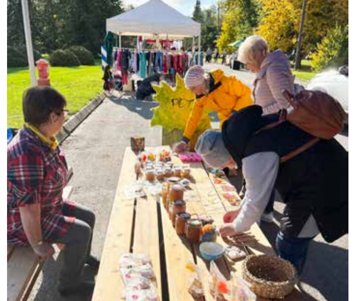
Uute uiskude kogumisfond alustab.

Kuna oli sügise esimene päev, siis tervitasime sügist oma valmistatud rannakaartidega.