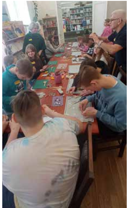
Töötua öökullid ja liblikad valmisid lindlast saadud sulgedest.