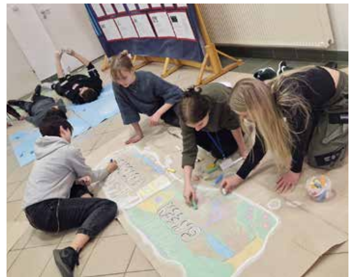
Teemakohase plakati tegemine.