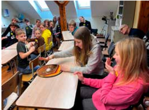
Munalaboris saab tarvilikke teadmisi.