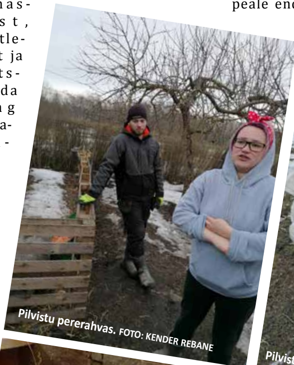
Pilvistu pererahvas.

Pilvistu hobitaluga tegi tutvust SIRJE REBANE