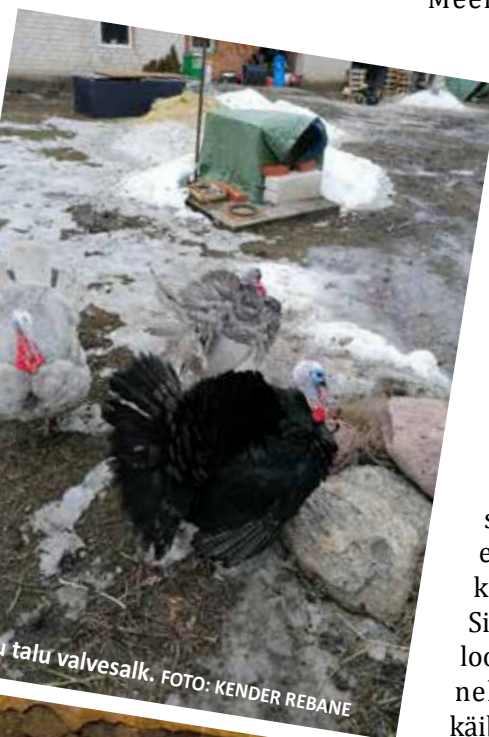
Pilvistu talu valvesalk.