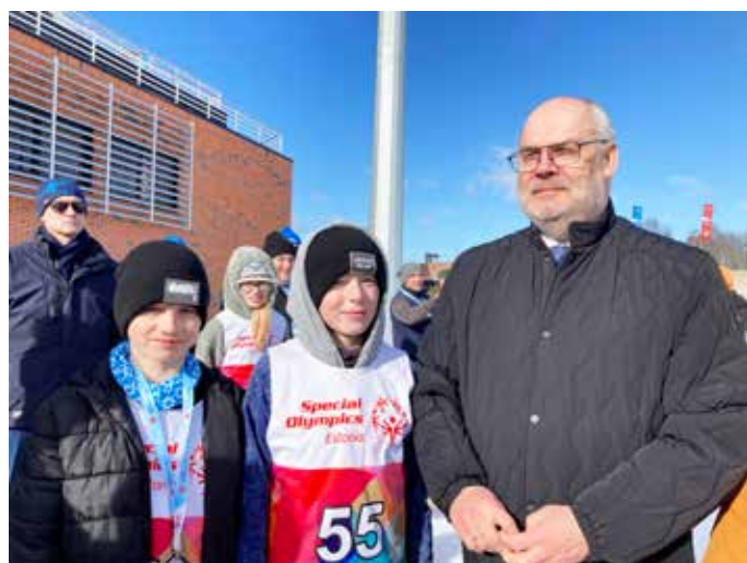
Pildil koos Eesti Vabariigi presidendi Alar Karisega.

Otepää suusaradadele kogunes kaheks päevaks 132 eriolümpia sportlast Eesti eri paigust, sealhulgas Näpi kooli tublid suusatajad. Neile lisaks sportlased Lätist, Leedust, Hollandist, Sloveeniast, Slovakiast, Austriast, Poolast ja Soomest.