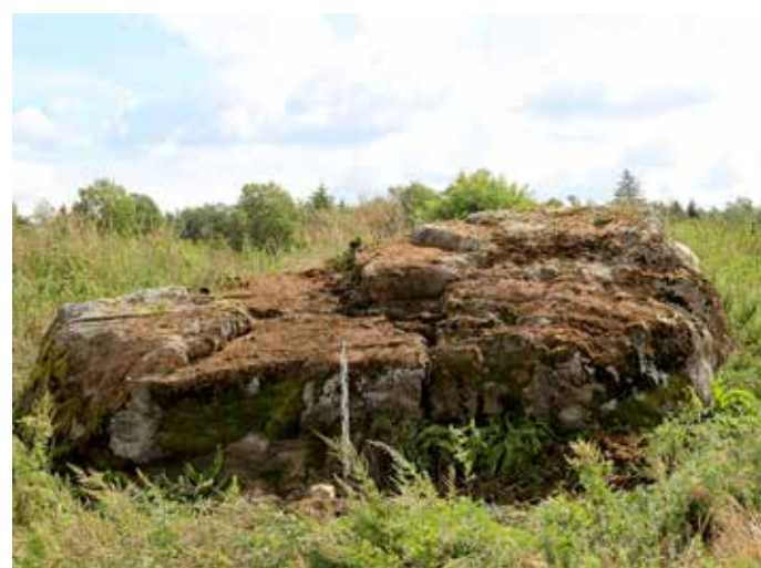
Rakvere vallas Varudi-Altküläs paiknev ohvrikivi.

Hiiekivi pühaks pidav pärimus ja rituaalne kasutamine ulatub 19. sajandisse ja tõenäoliselt palju kaugemasse aega. Pärimuses kajastatakse kivi seost libahundiks käimisega,