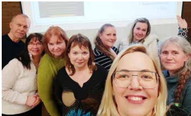
MTÜ-de kohtumine looduses.

Esimene samm on selle kohtumisega astunud, järgmine kokkusaamine toimub Ubjas ja seostatakse küla raamatukapi avamisega.