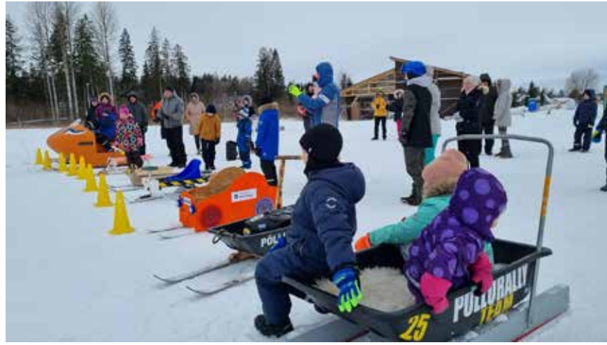
Omanäoliste kelgude kokkutulek.