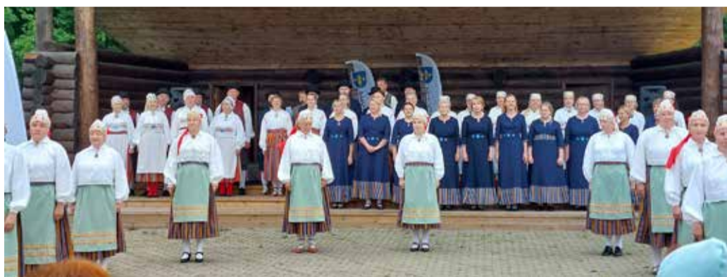
Vaba Rahva Tants Uhtnas.