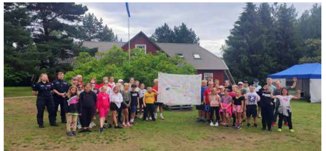
Valla noorte ühislaager Rannapungerjal.

Laagri viimasel õhtul toimus filmiõhtu/öö – seekord hoopis õues! Vaatasime