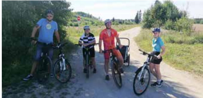
Kahe võistkonna kohtumine Kõrgemäel.