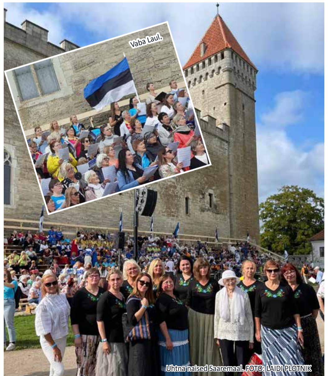
Uhtna naised Saaremaal.