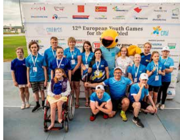
Eesti koondis, ujujad ja kergejõustiklased lõputseremoonial.

Suur tänu kõikidele toetajatele ja kaasajajatele,