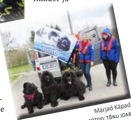
Märjad Käpad.

sellega edasi tegutseda ja korraldada koolis õppepäev, et tutvustada erinevate tege- vuste kaudu õpilastele pääst- jate tegevust, tegevuse vaja- likkust ja