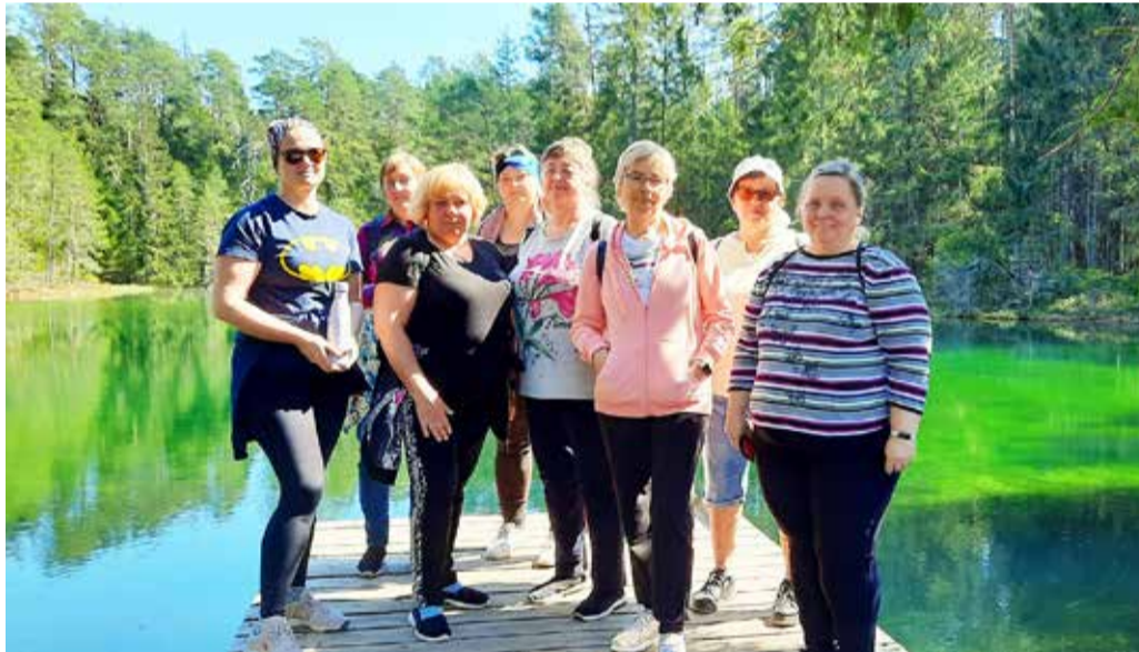
Veltsi lasteaed-alkkooli töötajad Äntu Sinijärve ääres.

Õpetajatöö pakub rohkes- ti arenguvõimalusi, aga see on ka vastutusrikas ja väga stressirohke. Seetõttu on oluline korras aeg maha võtta ja eraldada igapäeva- sest töökeskkonnast, leida aega, kosutada meelt ja hin- ge, sest meie amet põhineb usaldusel, soojal suhtlemi-