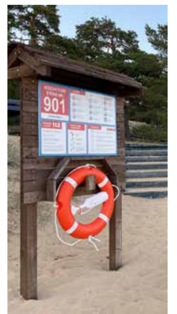
Veeohutusstend Kauksi rannas.

Veeohutuse kohta loe veel www.veeohutus.ee