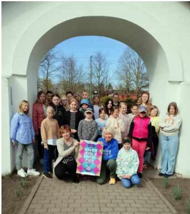
Laulupeolised rajasid lillepeenra.

Nauditavat esinemist teile! Koostöös noortepeo korraldajatega kutsuti koori- ja tantsurahvast „Teeme ära“ talgupäeva raames külvama