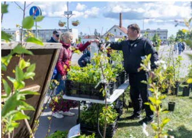
Nunnutada sai koduloomi, loomulikult oli traditsiooniline lammaste pügamine, tegevusi pere pisematele ning käsitöö- ja taimelaat.

Maist on KredExi partner Lääne-Viru Omavalitsuste Liit