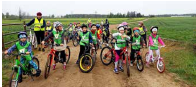
Lisaks sõideti virtuaalsel Tartu Rattarallil.