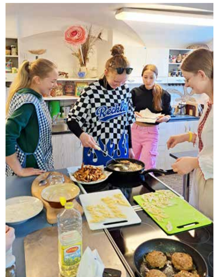
Õpilased nn seakõrvu valmistamas.

Õpilaste arvates oli õpetajata tund uudne ning väga põnev, sai ise ennast mitmeski asjas proovile panna – keeleoskuses, suhtlemises, juhendamises, toiduvalmistamises, iseseisvuses, aga ka empaatias ja teise inimese mõistmises. Vahetund ei tulnud küll kellelegi meelde ning ära mindi ka hiljem, oleks kauemakski jäädud, kui poleks pidanud koolibussi peale kiirustama.