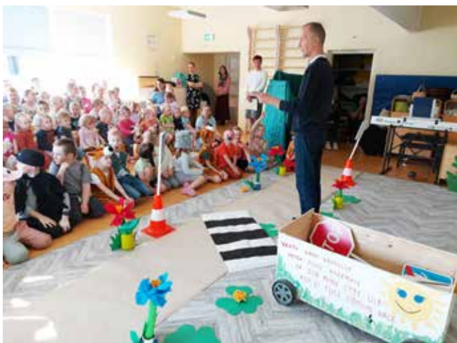
Liiklusvankri üleandmine Sõmeru lasteaias.