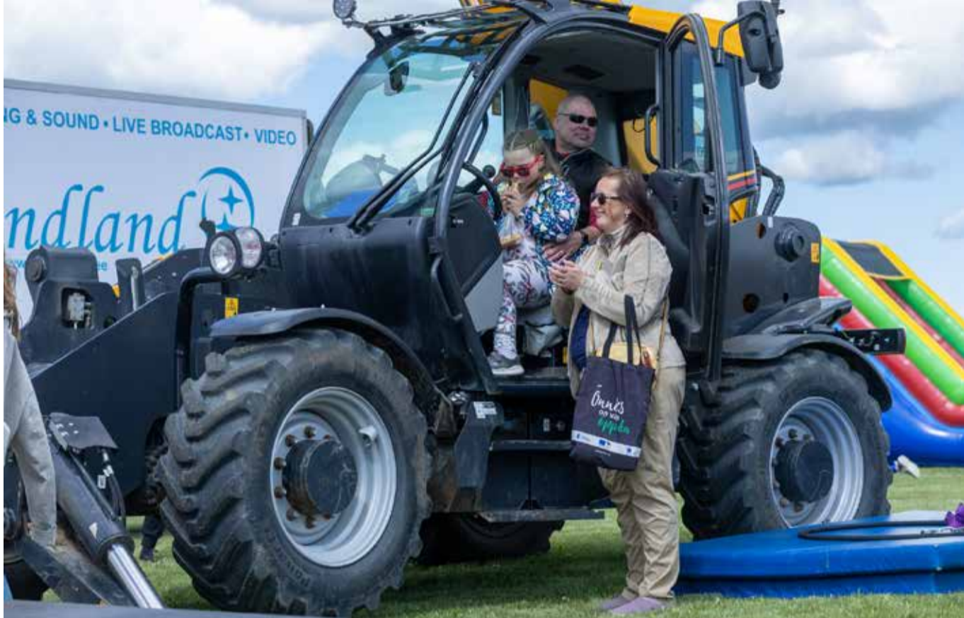
Festivalil tutvustati talutehnikat.

Kui 1. juunil 2013 sai teoks I Sõmeru lambafestival, ei osanud keegi pakkuda, kui pikk on selle iga ja millist menu üritus endaga kaasa toob. Aga juba esimene avapauk köitis suure hulga osalejate ja külaliste tähelepanu, sest läbi Sõmeru kulges lammaste paraad. Oma pügamis- oskust paraadiliste peal näitasid professionaalsed Uus-Meremaa pügamiseistrid. Peakangelane sellel üritusel ja järgnevatel oli lammaste lambatooted, näitused, toidud jne. Festivali algne idee ja teostus sündis Rägavere mõisa ja tollase Sõmeru vallavalitsuse koostöös, mida toetas PRIA. Kolme lambafestivali järel laiendati teemat ja õigusjärglane hakkas kandma nime Maaelufestival, mis 2017. aastal pärjati regionaalmaasika auhinna. „Tänu Sõmeru vallavalitsuse aktiivsusele ja heale koostööle kohalike