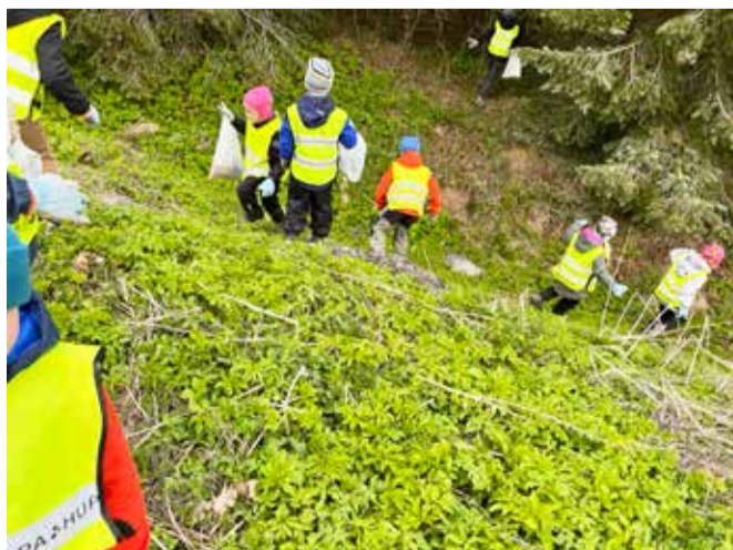
Ja Uhtna Tähetäpsid tegid ära.