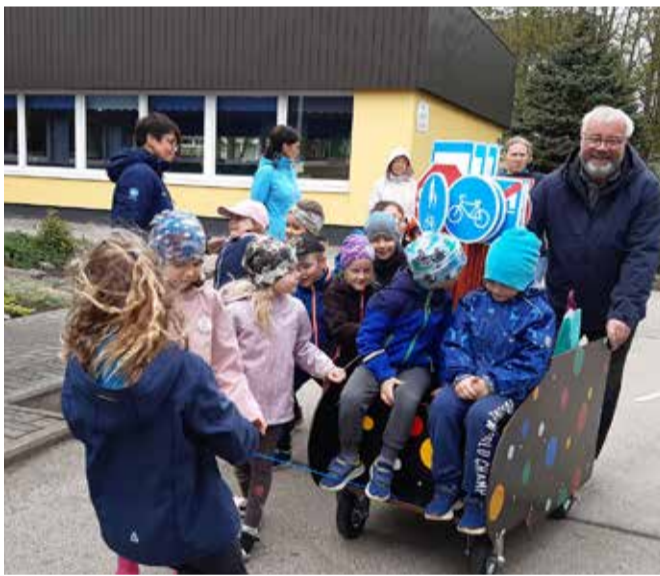
Liiklusvankri üleandmine Uhtna lasteaias.

Kuna väiksed lapsed omandavad teadmisi ja õpivad praktilisi oskusi mängu kau-